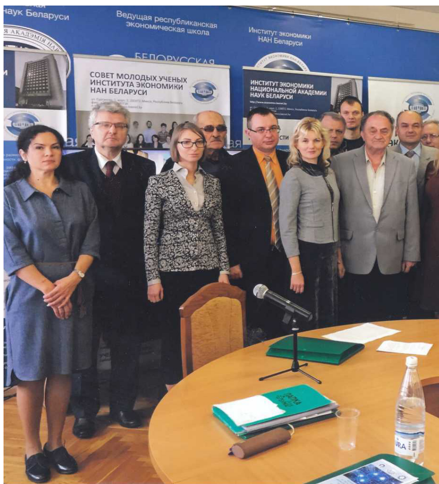
Заседание круглого стола «Дезинформация в средствах массовой информации и Интернете: пути преодоления»

Принципиально важно не заговаривать проблему, не превращать в мир 1000 слов. Необходимо способствовать тому, чтобы вектор борьбы с коррупцией из судебного-криминального превратился в общественно-политический. РООЗПЧ (БС МОПЧ) примет активное участие в мобилизации общественности в деле преодоления коррупции.