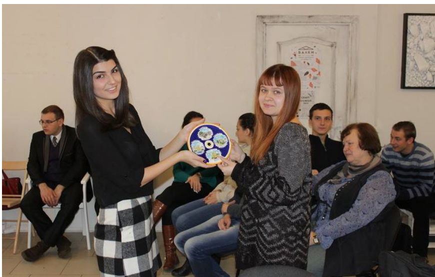
Момент вручения молодёжной группе БС МОПЧ памятного сувенира представителем секции МОПЧ от Азербайджана во время международного молодёжного семинара в ноябре 2015 года в Минске

Комментарий от рецензентов. На фотографии момент вручения молодёжной группе БС МОПЧ памятного сувенира представителем секции МОПЧ от Азербайджана во время международного молодёжного семинара, состоявшегося в ноябре 2015 года в городе Минске. Такие мероприятия нашей организацией и дальше будут поощряться.