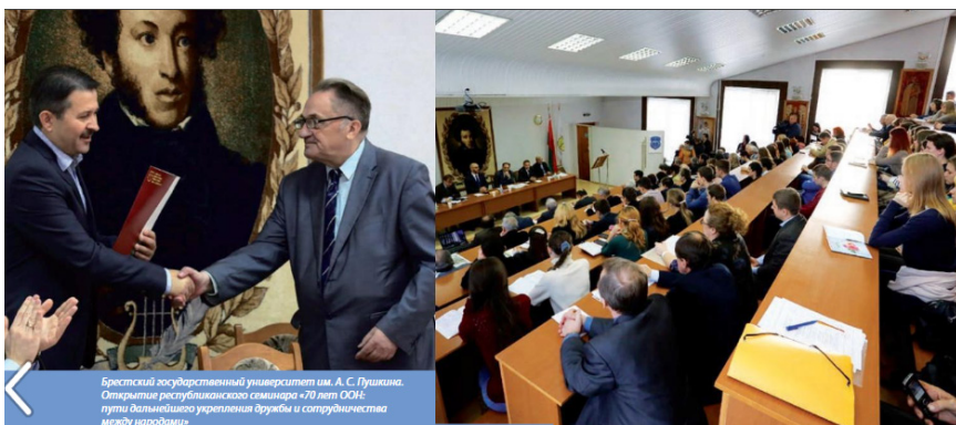
Брестский государственный университет им. А. С. Пушкина. Открытие республиканского семинара «70 лет ООН: пути дальнейшего укрепления дружбы и сотрудничества между народами»