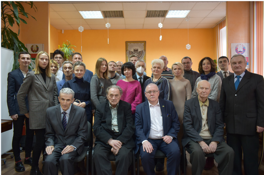
Юбилейная встреча 18 декабря 2021 года по случаю 25-летия организации