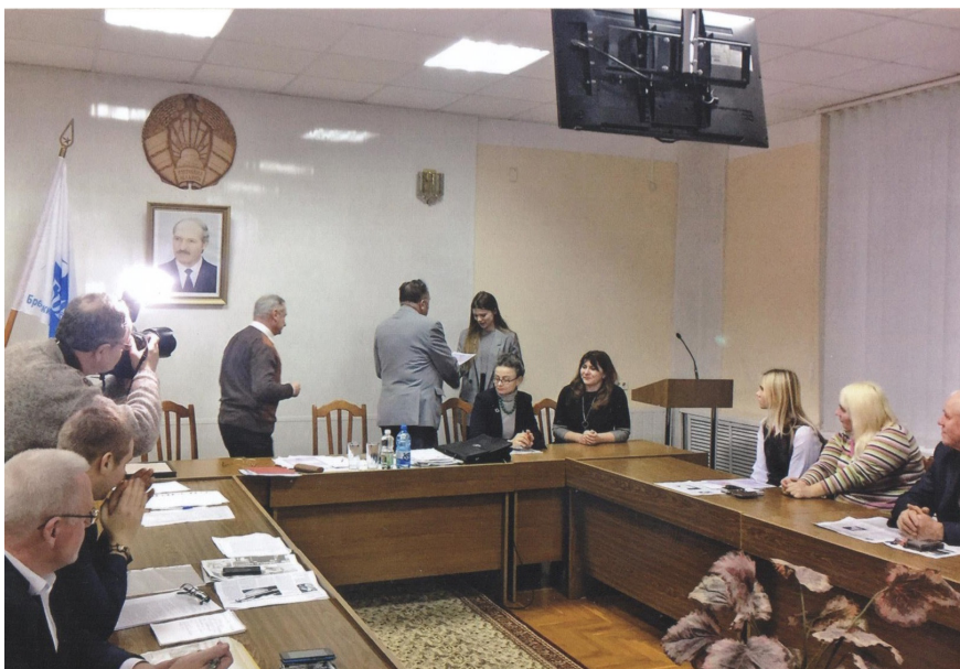
Семинар по случаю 70-летия Всеобщей декларации прав человека (07.12.2018)