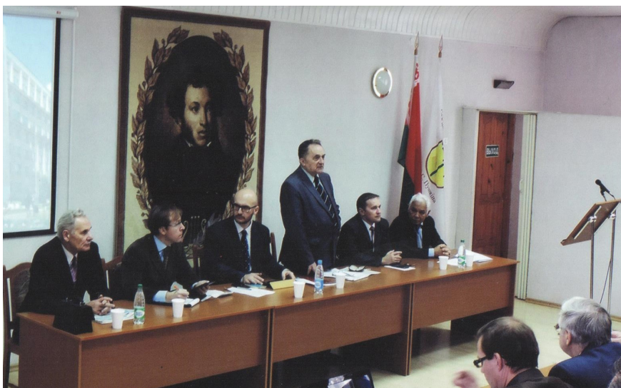
Семинар по случаю 70-летия ООН (26.10.2015)