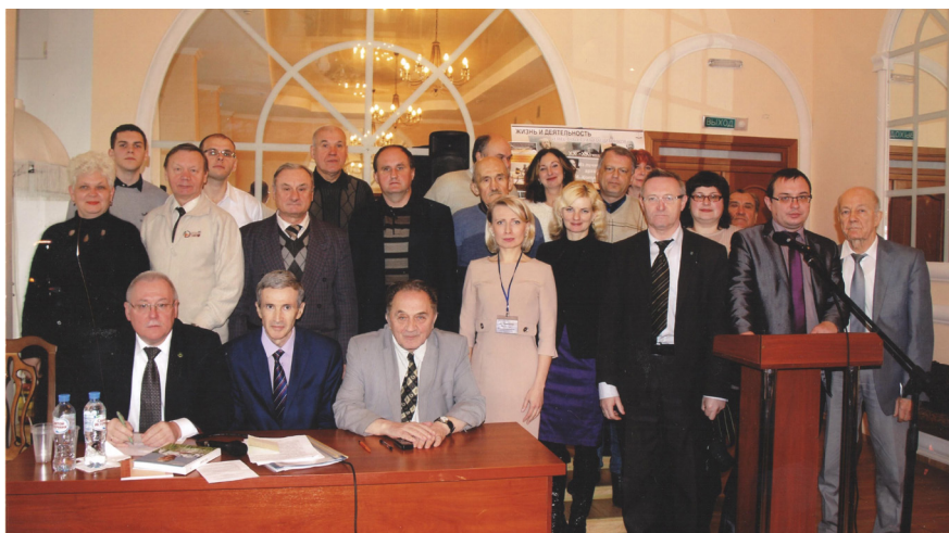
Участники семинара «Права человека и личность» (08.12.2018)