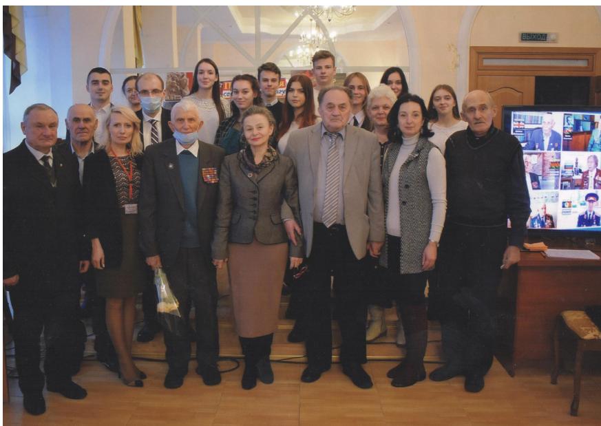
Участники круглого стола по случаю 75-летия Победы в Великой Отечественной войне (12.12.2020)